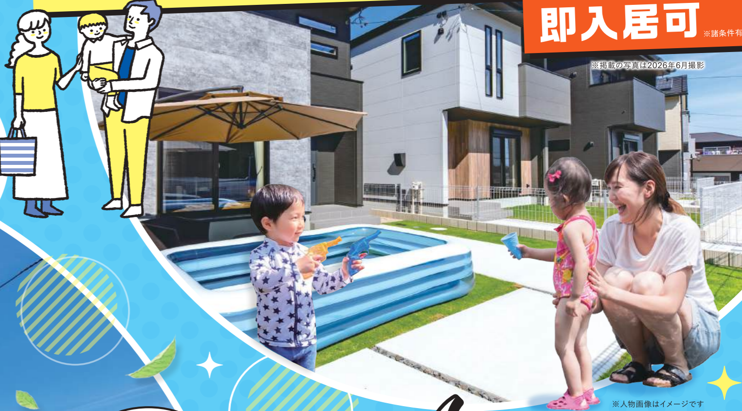
※掲載の写真は2026年6月撮影