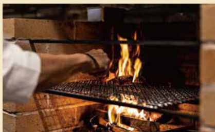
BiXiGARRi (ビシガリ) (スペイン料理)

本場の味を届けるスペイン料理からファンタジックなパン屋さんまで、おいしい幸せをあなたの毎日に。