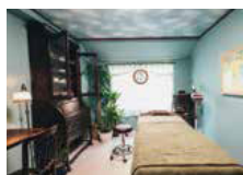
Clay Detox Salon kiyora (プライベートサロン)

キレイを目指す女性のための完全プライベートエステサロン。クレイ(泥)とリンパケアによる肌と体のデトックスで自己回復力を高めます。