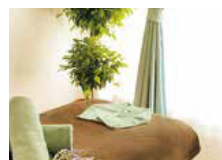
リラクゼーションサロン arius (ヘッドスパ)

Map 11 □住所/仙台市宮城野区欄間1-6-8 タニビル1F □営業時間/9:00~21:00 □営業時間/GW, 秋祭, 年末年始 (徒歩9分)