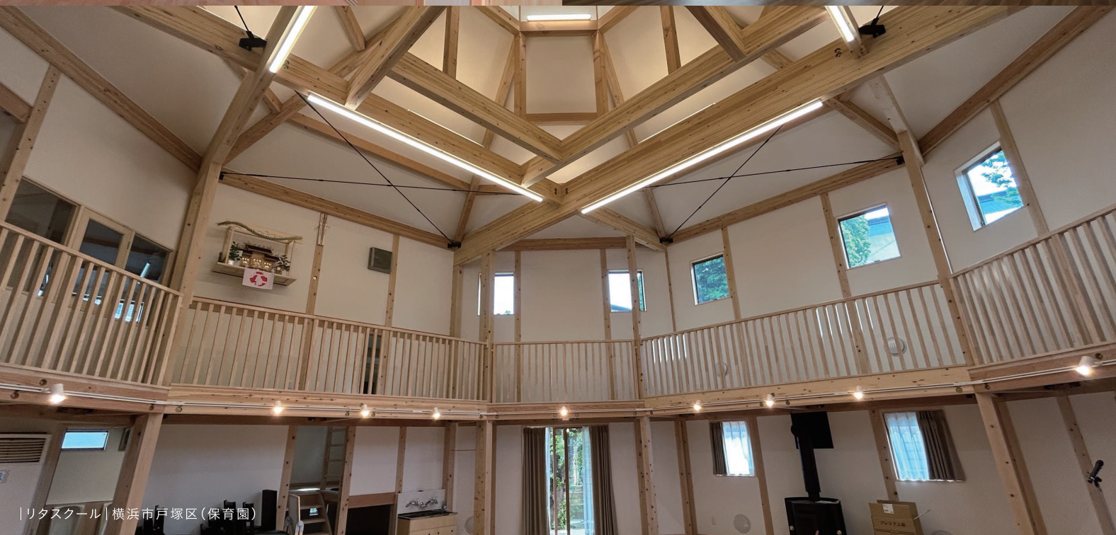
リタスクール | 横浜市戸塚区(保育園)